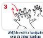
Wrijf de rest van de handpalmen over de linker handrug en omgekeerd