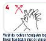
Wrijf de rechter handpalmen tegen de linker handpalmen met de vingers van beide handen tussen elkaar