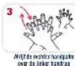
Wrijf de rest van de handpalmen over de linker handpalm en omgekeerd